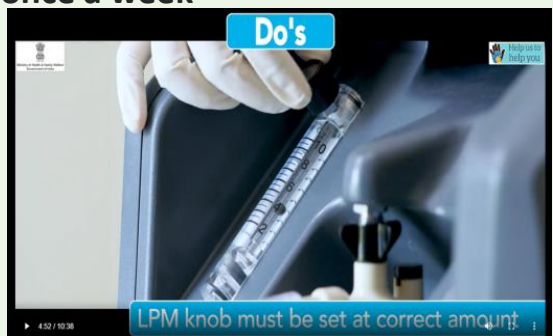
LPM knob should be set at correct amount as prescribed by doctor