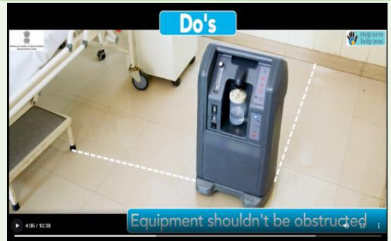
Keep OC away from wall/screens