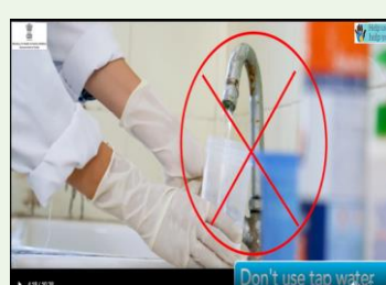
Do not use TAP Water for humidifier bottle