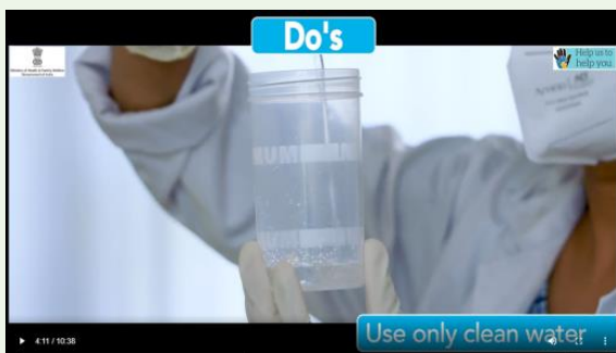
Use clean water to fill the humidifier bottle