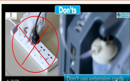
Do not use extension cord for power supply