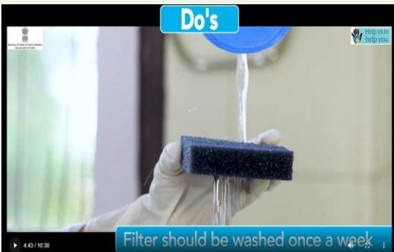
External filters should be cleaned once a week