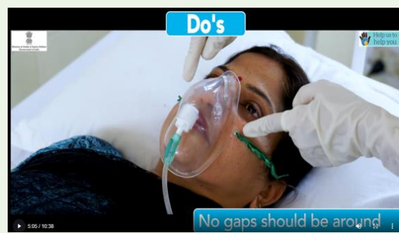
Ensure no gap around face mask