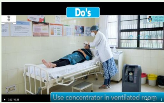
Use OC in well Ventilated Room