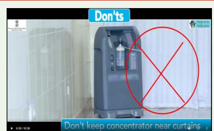
Do not keep OC near curtains