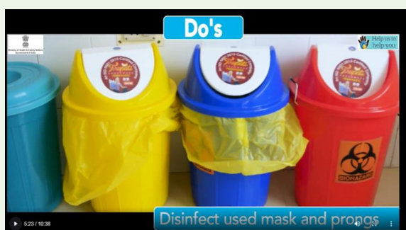
Follow infection control protocol for disposal of consumables