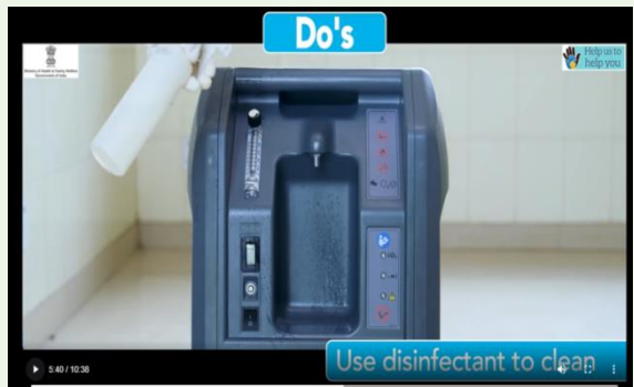
Use disinfectant/ soap solution to clean OC cabinet